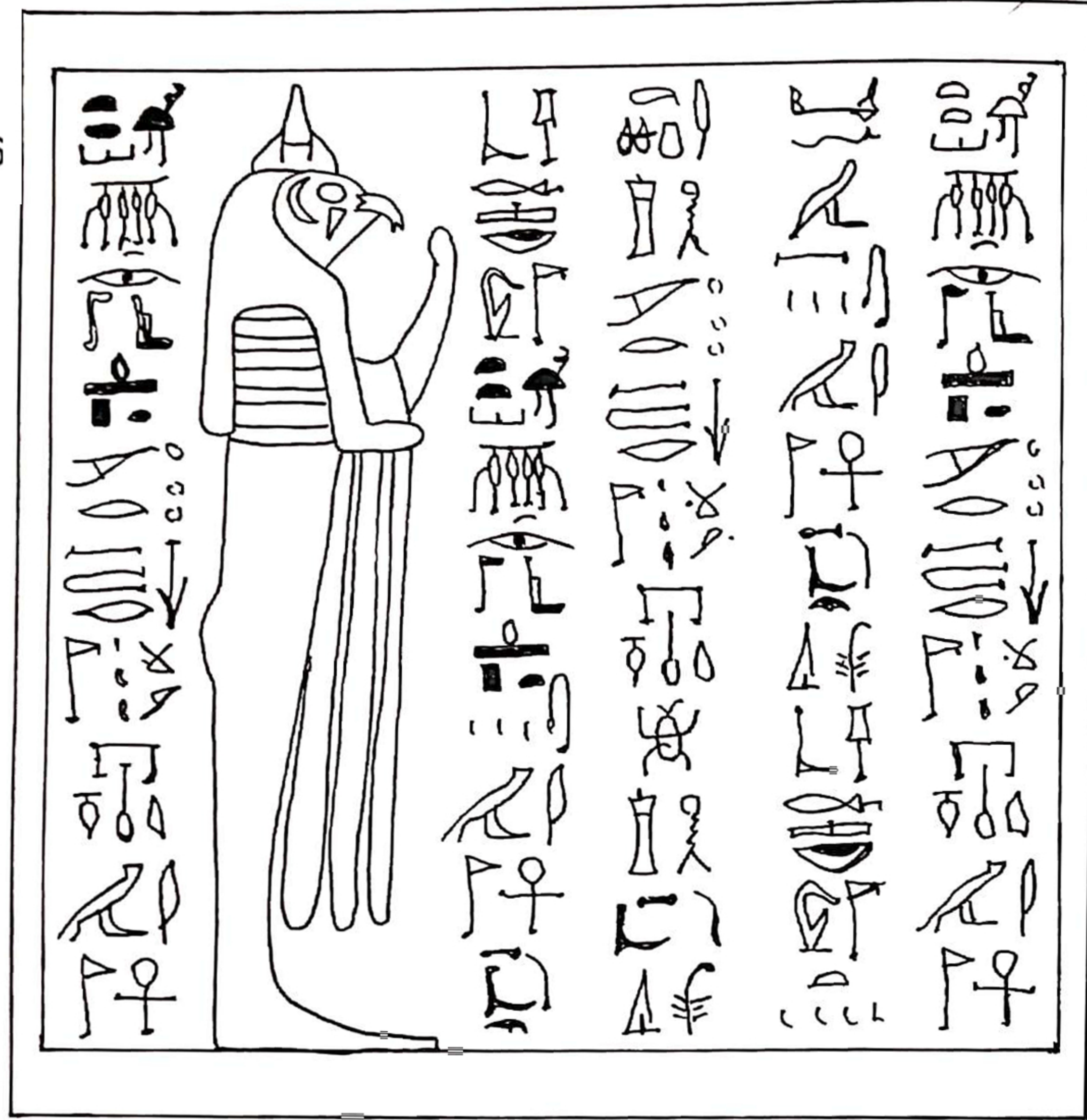
Ejemplificación de escritura egipcia en muros, tallada.