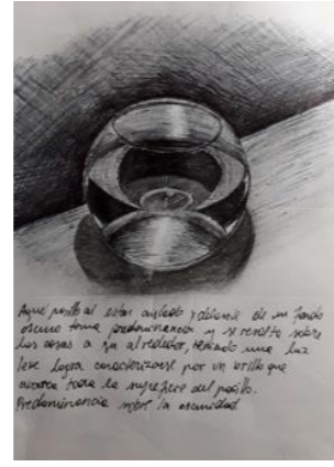
Aquel pocillo al estar aislado y ubicado al un fondo oscuro toma predominancia en su resalta sobre las cosas a su alrededor, además de tener una abertura que da cabida a un contraste que prioriza los tonos más lúgubres. Iluminación leve que da espacio al contraste.