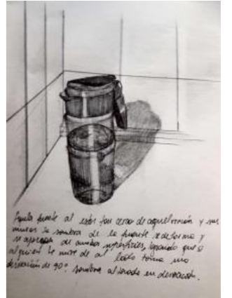
Aquella fuente al estar tan cerca del rincón y sus paredes, logra una deformación en su sombra. Su sombra se apropia de ambas superficies (la base y la pared), logrando que al mirarlo de su lado posterior entrega una visión de 90 grados (refiriéndose a la sombra y su desviación). Sombra alterada en desviación.

La luz que impacta a este recipiente se manifiesta de forma uniforme y sin muchas alteraciones, más que una línea que recorre todo el largo de aquel recipiente, además de contraponer otra línea oscura que da cabida a un contraste que prioriza los tonos más lúgubres. Iluminación leve que da espacio al contraste.