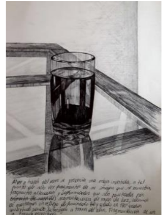
Al ver a través del vaso se presencia una imagen invertida, a tal punto de sólo ver fragmentos de su imagen que se muestra. Fragmentos alterados y deformados que son atravesados por segmentaciones de rayos de luz, además de mostrarnos un reflejo difuminado girado en 180 grados, contextualizando la imagen a través del vaso. Fragmentación de un “a través” proyectado.