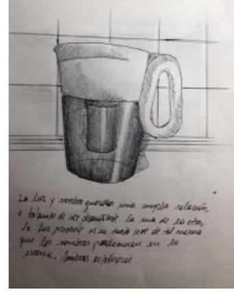
La luz y sombra guardan una amplia relación, a tal punto de ser dependiente la una de la otra. La luz presente es un tanto leve de tal manera que las sombras predominan en la escena. Sombras extrínsecas.