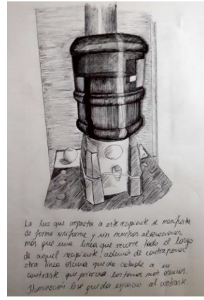
La luz que impacta a este recipiente se manifiesta de forma uniforme y sin muchas alteraciones, más que una línea que recorre todo el largo de aquel recipiente, además de contraponer otra línea oscura que da cabida a un contraste que prioriza los tonos más lúgubres. Iluminación leve que da espacio al contraste.