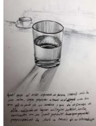
Aquel vaso al estar expuesto de forma evidente ante la luz solar, logra proyectar a través de él una luz que es parte de su sombra y que da definición de ella, además de lograr múltiples detalles, brillos, contrastes en su parte superior. Proyección de la luz a través de un intermediario.