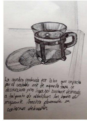
La sombra producida por la luz que impacta por el costado este de aquella taza se distorsiona pero logra ser bastante delineada, a tal punto de identificar los bordes del recipiente. Sombra plasmada en contornos delineados.