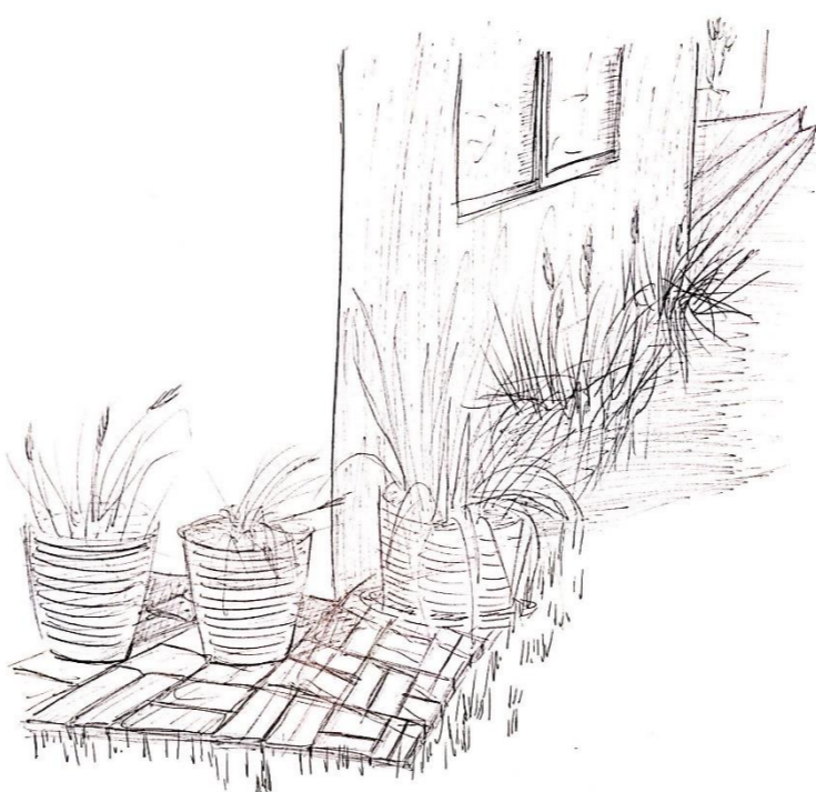
8.- Las plantas rodean la esquina generando un espacio con vida, claramente demarcando donde se ubican.

7.-Las plantas delimitan su espacio donde habitan, hay un cuidado en que cada una tenga su lugar donde crecer y no ser entorpecido por la maleza.