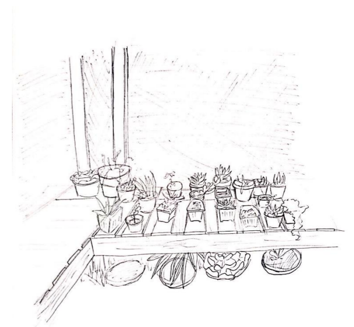
3.- Sobre los niveles existen tablas que marcan los lugares donde se puede habitar con plantas, la malla que rodea deja pasar la luz para que llegue a ellas.

2.-El jardín se extiende y crece hacia arriba, envolviéndolo y mezclándose con el entorno, se adapta a la verticalidad de la estructura.