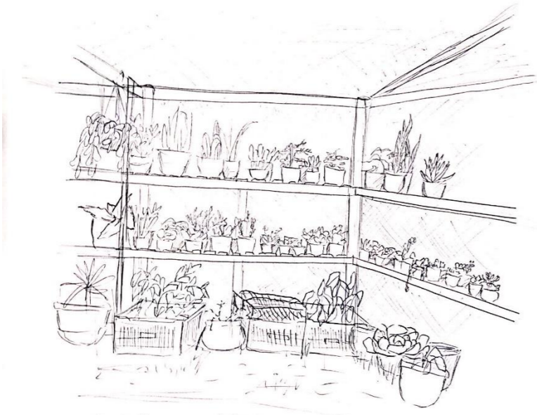
1.- Entre límites y superficies en altura, existe una diversidad en tamaños y formas, hay tres niveles de plantas.