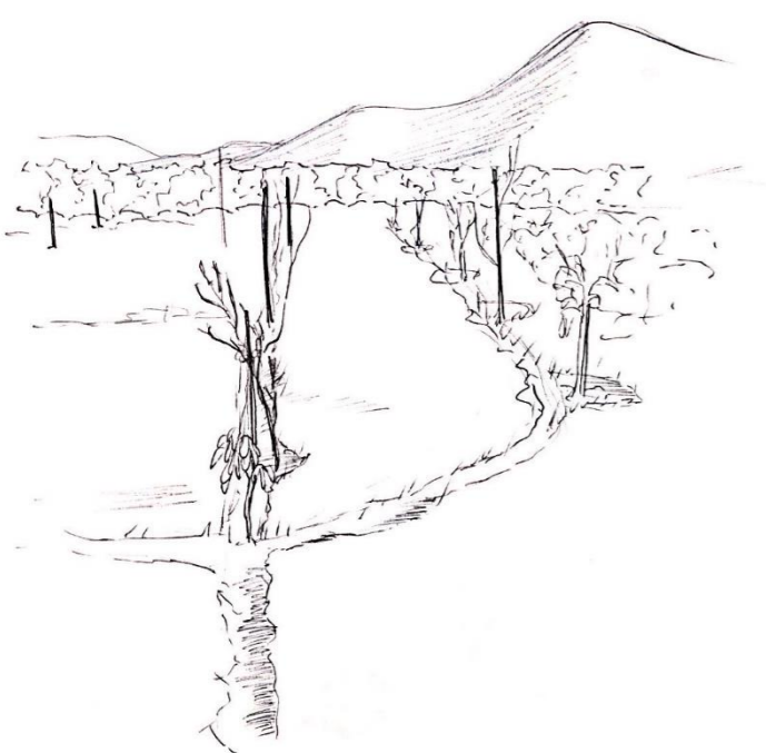
7.- Hay un cuidado con el crecimiento de las plantas, para que sigan derechas se usa un palo recto de guía, para que el agua llegue a ellas se utilizan acequias que recorren todas las plantas.

6.-La extensión del cajón de cabida a un espacio dedicado al crecimiento de las plantas, estas mismas hacen aprovechamiento de la estructura para enredarse y crecer en ella.