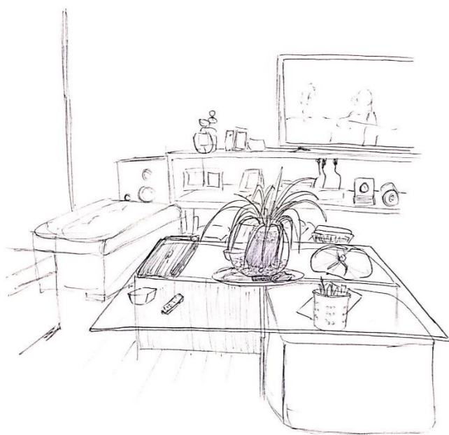
4.- Sobre una mesa se da vida con una planta en el centro, ésta está ubicada en un entorno donde será parte pero no predominará sobre él.

3.-Sobre los niveles existen tablas que marcan los lugares donde se puede habitar con plantas, la malla que rodea deja pasar la luz para que llegue a ellas.