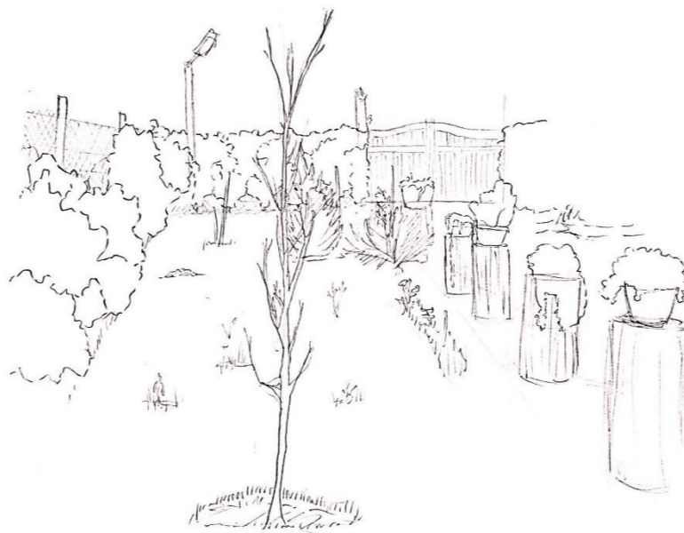
5.- Las plantas delimitan su espacio donde habitan, hay un cuidado en que cada una tenga su lugar donde crecer y no ser entorpecido con maleza.

4.-Sobre una mesa se da vida con una planta en el centro, ésta está ubicada en un entorno donde será parte pero no predominará sobre él.