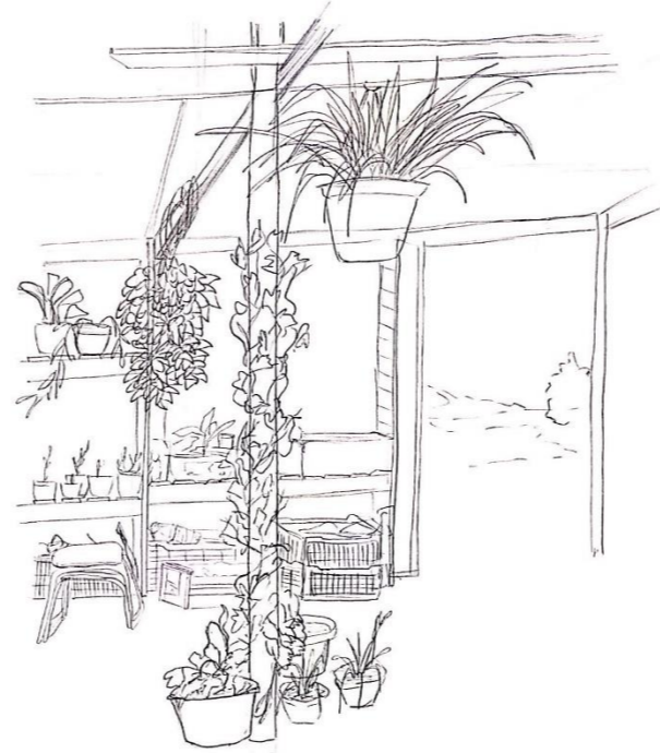
2.- El jardín se extiende y crece hacia arriba, envolviéndolo y mezclándose con el entorno, se adapta a la verticalidad de la estructura.

1.- Entre límites y superficies en altura, existe una diversidad en tamaños y formas, hay tres niveles de plantas.