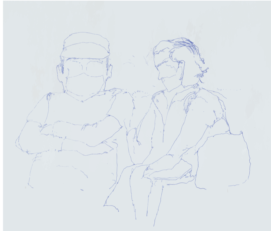
Oír es compartir un espacio confrontado, crear una envolvente propia aislada y expuesta a lo público. Este lugar dentro de un lugar trae intimidad.

El habitar del oír requiere de la atención de ambos participantes quienes a pesar de la situación de exterioridad en la que se encuentran crean en su entorno inmediato una envolvente privada en donde se relacionan con confianza, expresada en la gestualidad. Esta atmósfera confrontada por ambos participantes es un espacio separado de lo público pero en lo público.