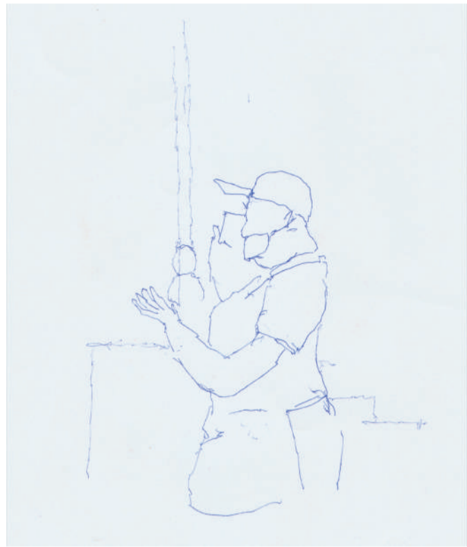
Una llamada. Situación breve, una escucha sin emisor presente pero que da lugar a una dimensión de intimidad expuesta en la gestualidad.