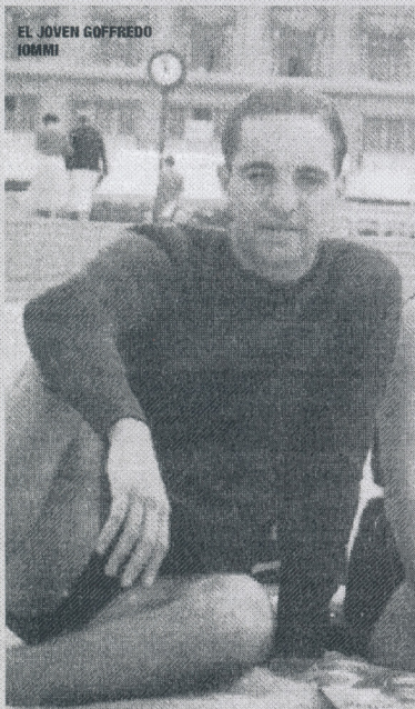
en mar del plata