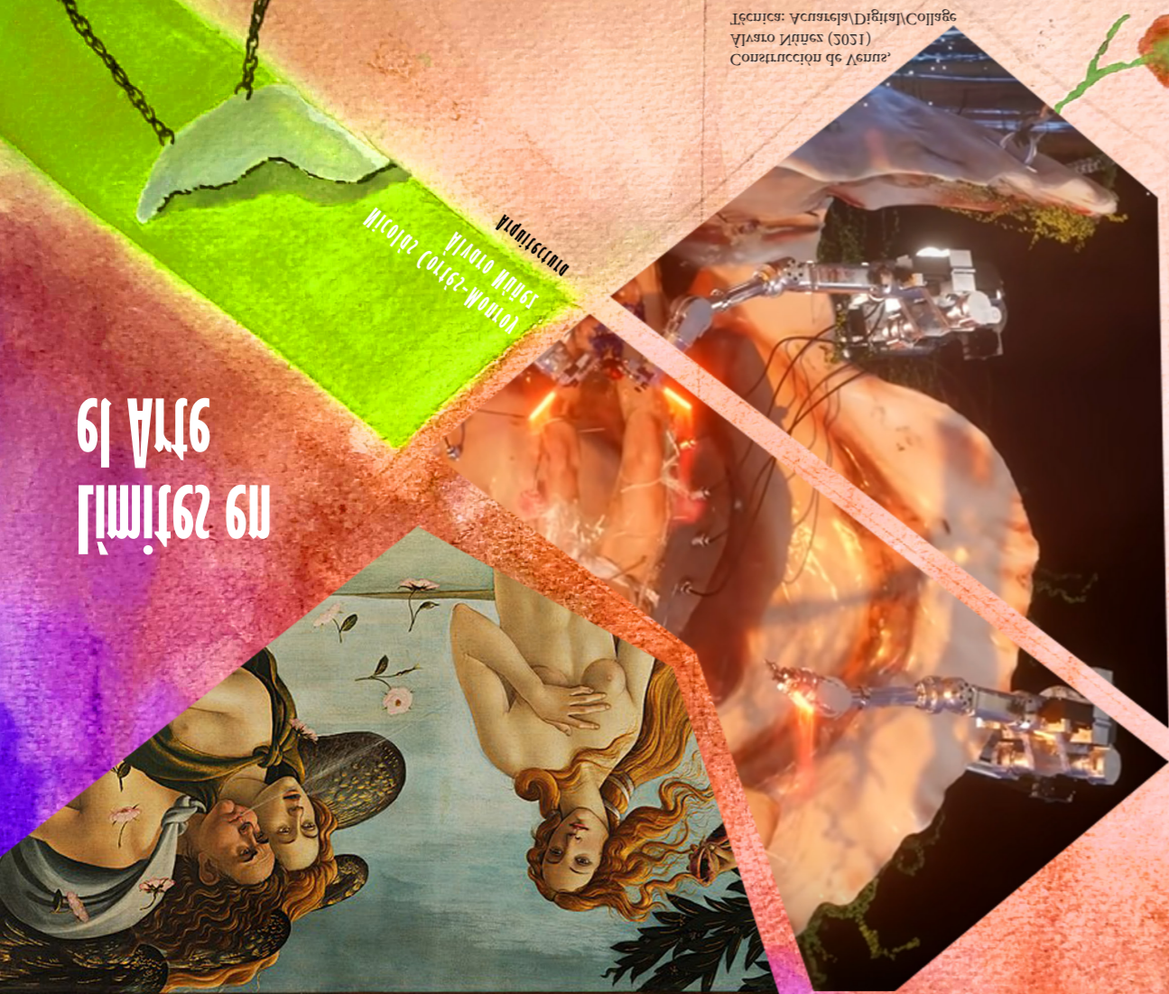
Técnicas: Acuarela, Digital, Collage Alvaro Núñez (2021) Composición de Venus