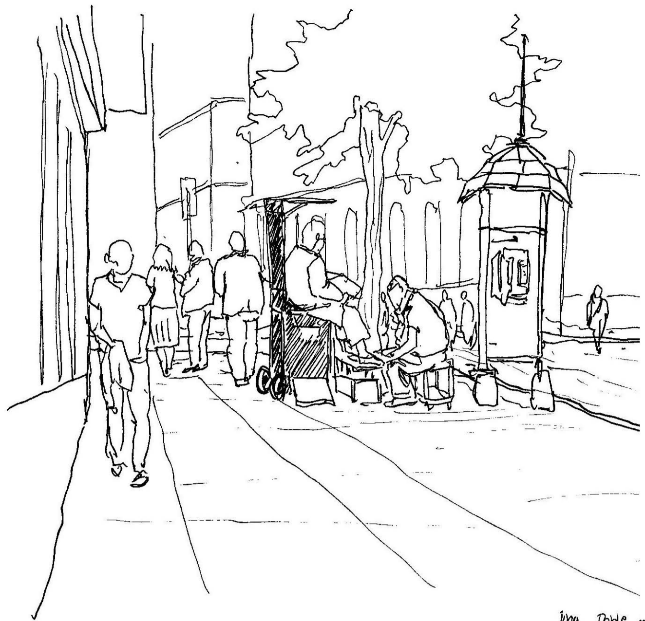
Una Doble reunión, descanso y asistencia.