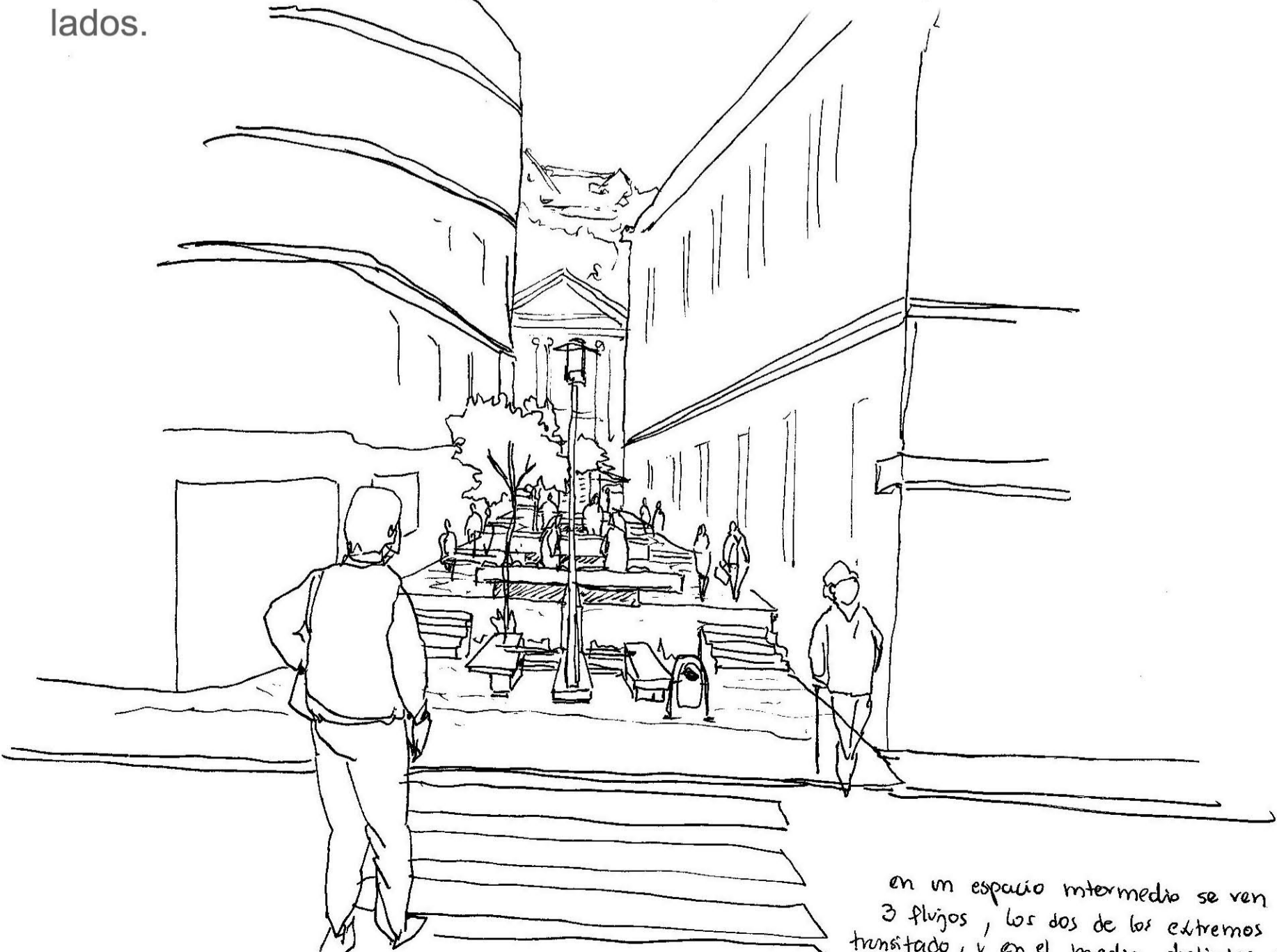
en un espacio intermedio se ven 3 flujos, los dos de los extremos densamente transitados, y en el medio distintos negocios se instalan; a vender comida, revistas, etc.

en un espacio intermedio se ven 3 flujos, los dos de los extremos densamente transitados, y en el medio distintos negocios se instalan induciendo la detención de los que transitan por los lados.