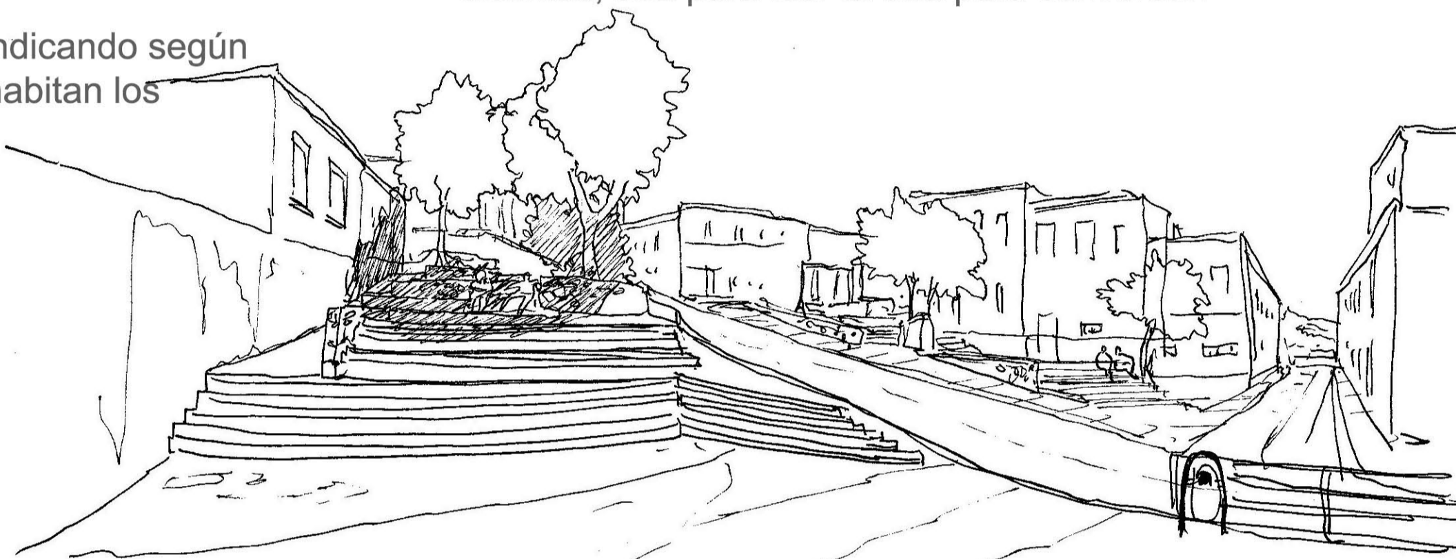
Se forman islas habitadas que el recorrido del sol va indicando según la sombra que proyecta para el refresco de quienes habitan los espacios.

se forman islas habitadas que el recorrido del sol va indicando según la sombra que proyecta para el refresco de quienes habitan los espacios.