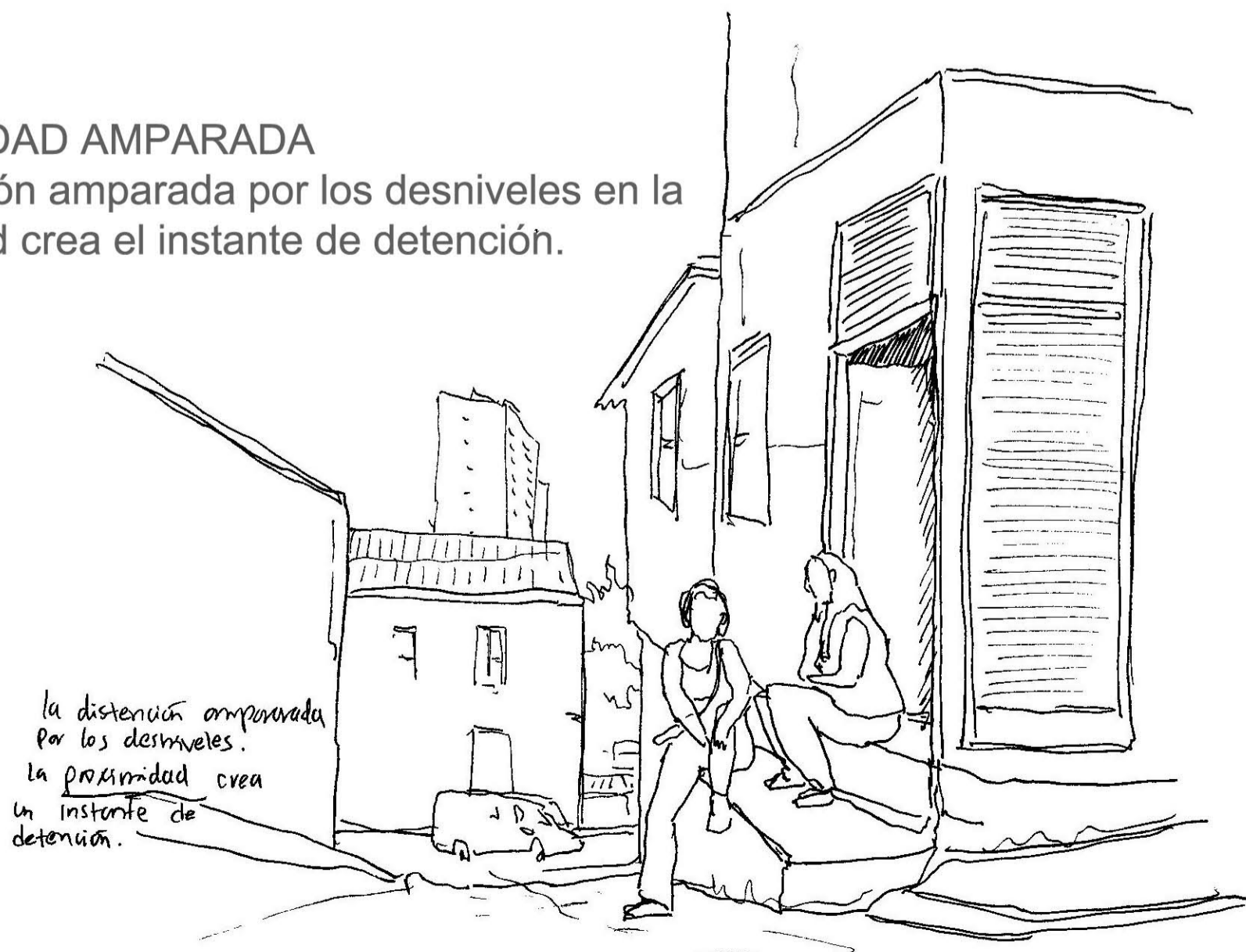
la distensión amparada por los desniveles. la proximidad crea un instante de detención.

la distensión amparada por los desniveles en la proximidad crea el instante de detención.