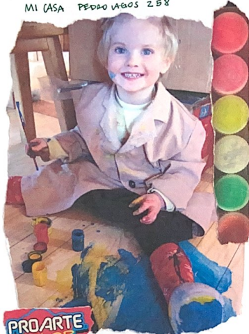
PRO ARTE COLOR