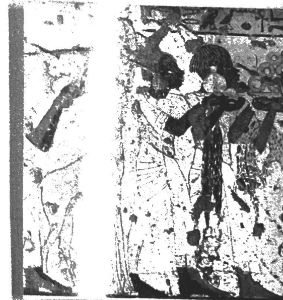
③ Indiferencia a la escala relativa de tamaños entre figuras y animales. El autor parece no haberse dado cuenta de que los animales son mucho más grandes que los humanos, lo que resulta visualmente absurdo.