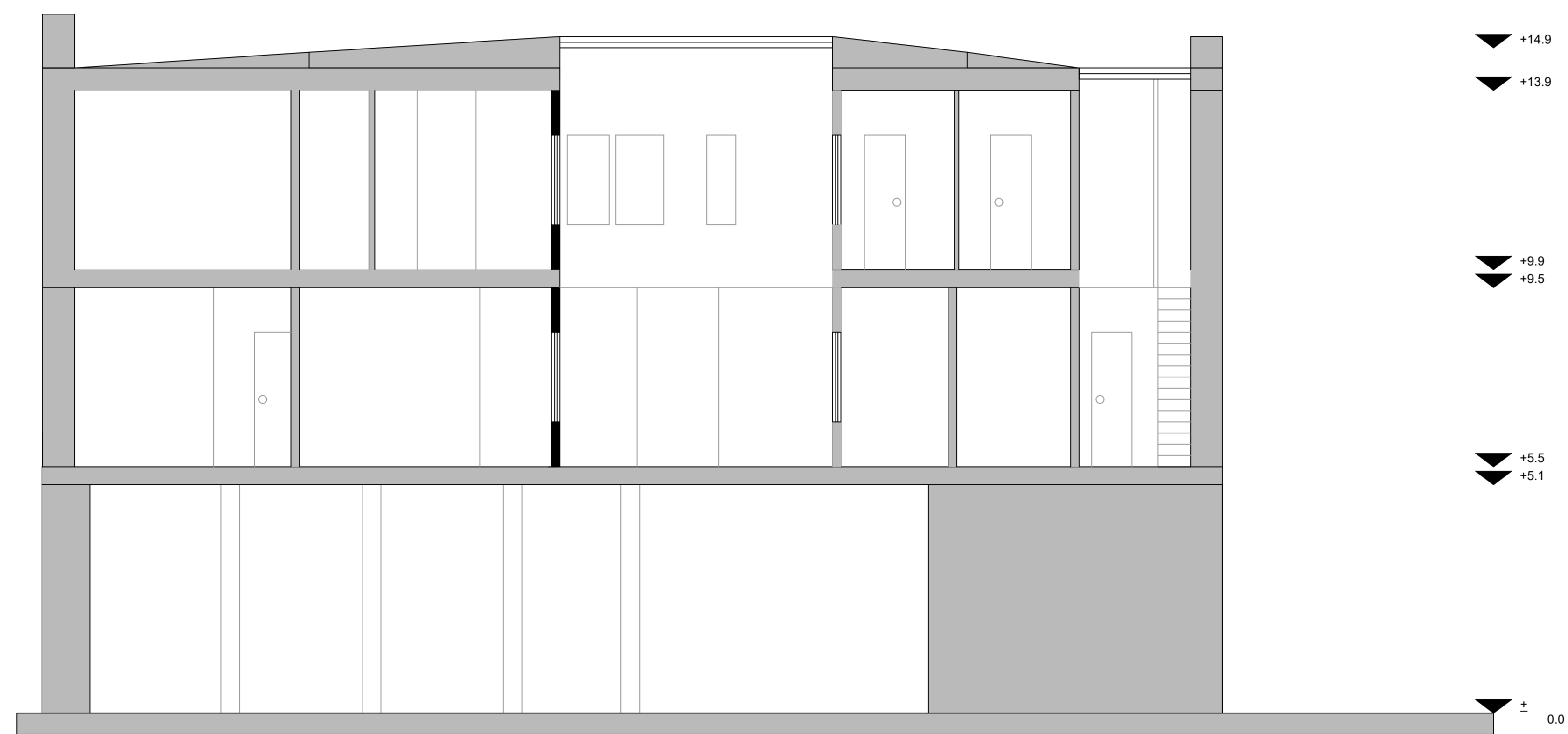
Situación existente Corte B-B' Escala: 1:100