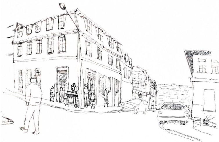
Figura N° 305

Se muestra cómo se relaciona el espacio público con el privado en un caso de vivienda colectiva en Valparaíso. El espacio público se encuentra en la calle y el espacio privado en las viviendas. Se muestra cómo se relaciona el espacio público con el privado en un caso de vivienda colectiva en Valparaíso. El espacio público se encuentra en la calle y el espacio privado en las viviendas.