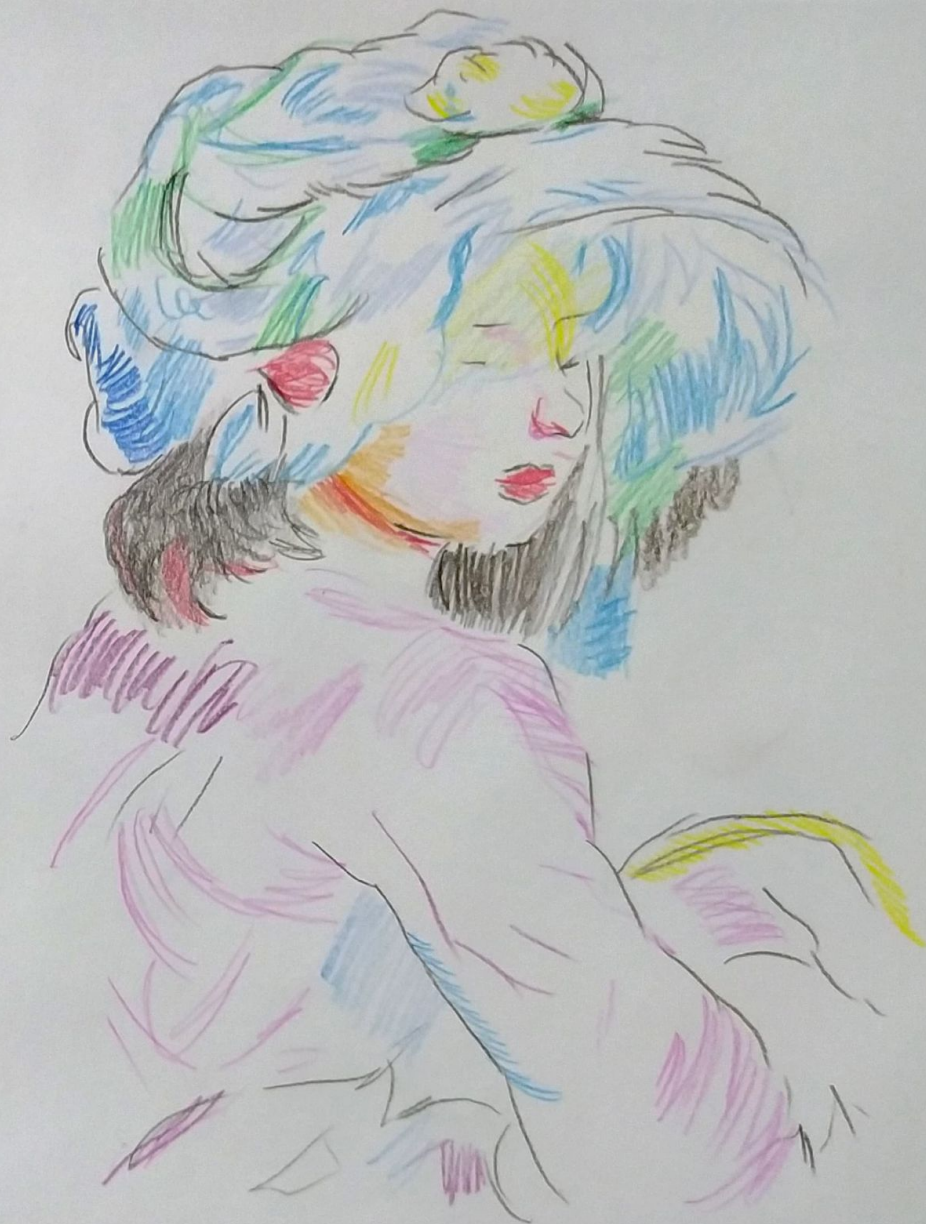
GIRL CARRYING A BASKET - BERTHE MORISOT (1871)