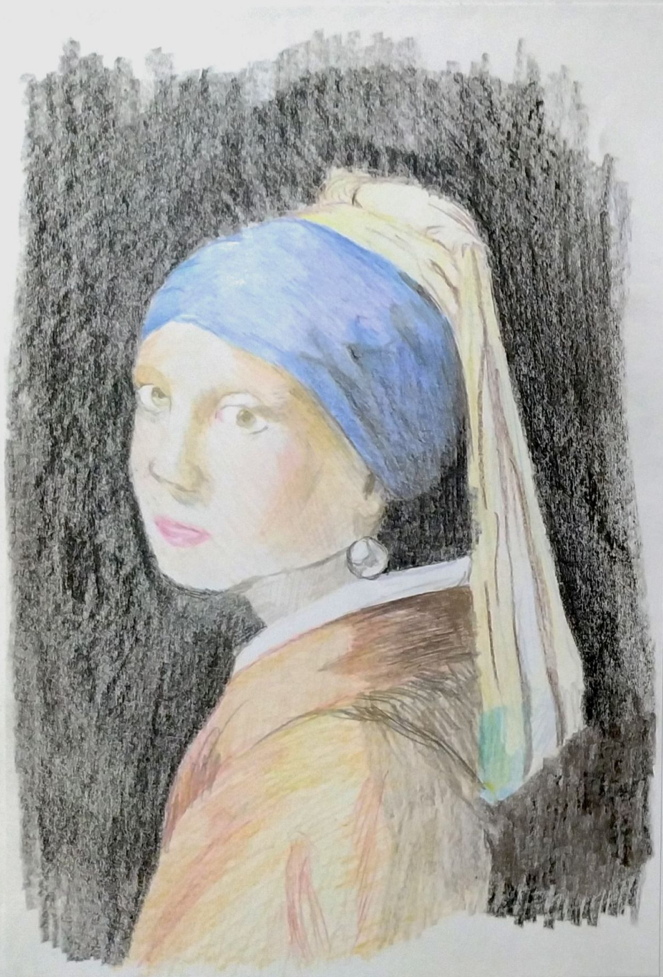
LA JOUEN DE LA PERLA - JOHANNES VEERMER (1665).