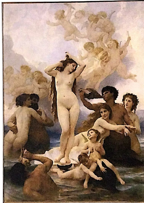
EL NACIMIENTO DE VENUS, 1879, WILLIAM BOUGUEREAU