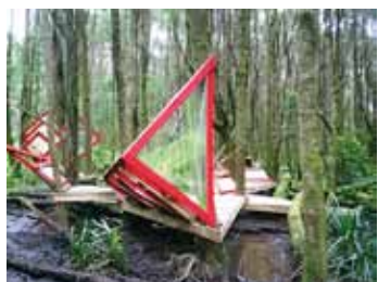
Travesía Mauñín Pangal, 2006