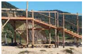
Travesía Isla Mocha, 2009