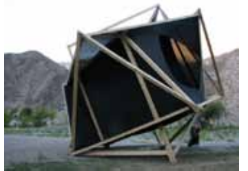
Travesía Alto del Carmen, 2008