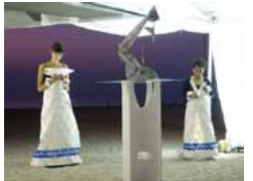
Travesía Purmamarca, 2007