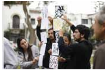
Travesía Lima, 2009