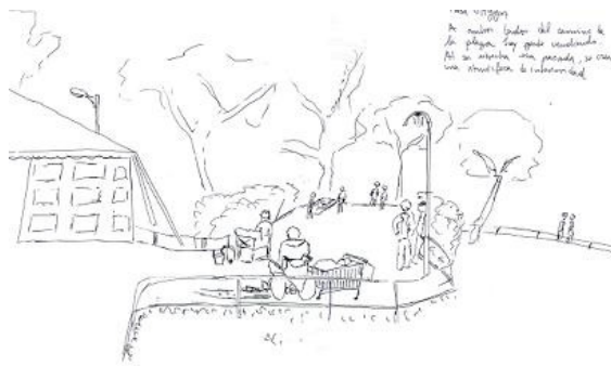
4. Plaza O'Higgins. A ambos lados del camino de la plaza hay gente vendiendo. Al ser estrecha esa pasadita, se crea una atmósfera de interioridad.