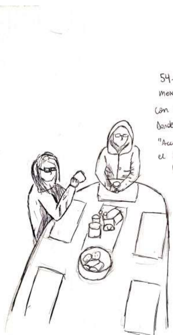
54- La forma circular de la mesa permite miradas directas y con ello invita a la comunicación. Desde sea que te sientes frente "Acercas" a oír a cualquiera por el espacio que ofrece la forma.