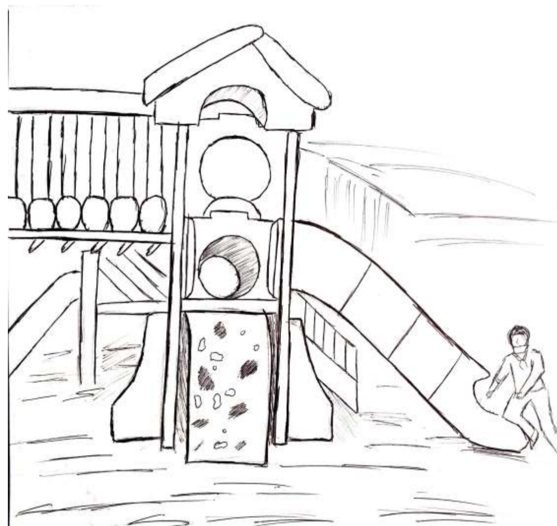
50- En la búsqueda de nuevos juegos, los niños aprovechan el eco que genera el tobogán para hablar de un extremo a otro. En este caso, no importa la distancia, mientras el sonido llegue al otro extremo.