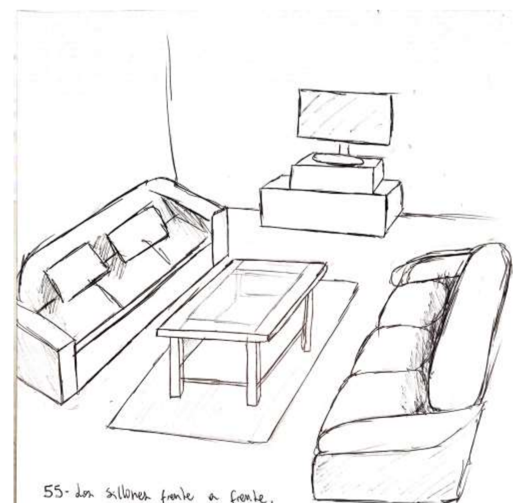
55- Los sillones frente a frente, la casa decorada de manera cómoda y un lugar de apoyo y equilibrio (mesa), acogen el oír y la comunicación. Sin embargo, la tele desvía el foco central, cambiando la atención cuando ésta se prende.