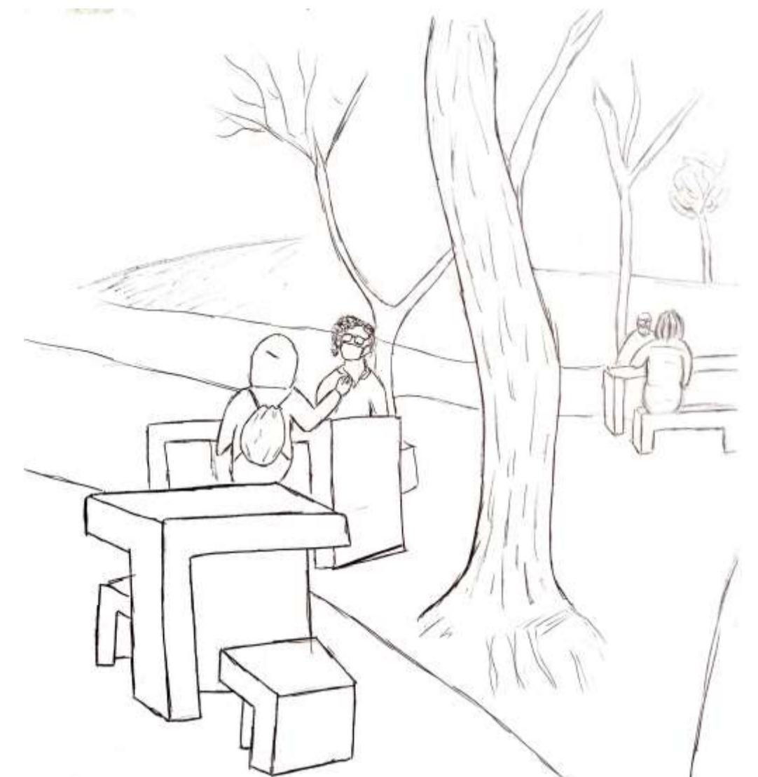
49- Las mesas distanciadas unas de otras pero en sí mismas, unen una comunicación directa. Todas contienen 2 sillas o más, y el espacio reducido permite sentarse y que al charlar, la conversación sea fluida, por la cercanía y dirección.