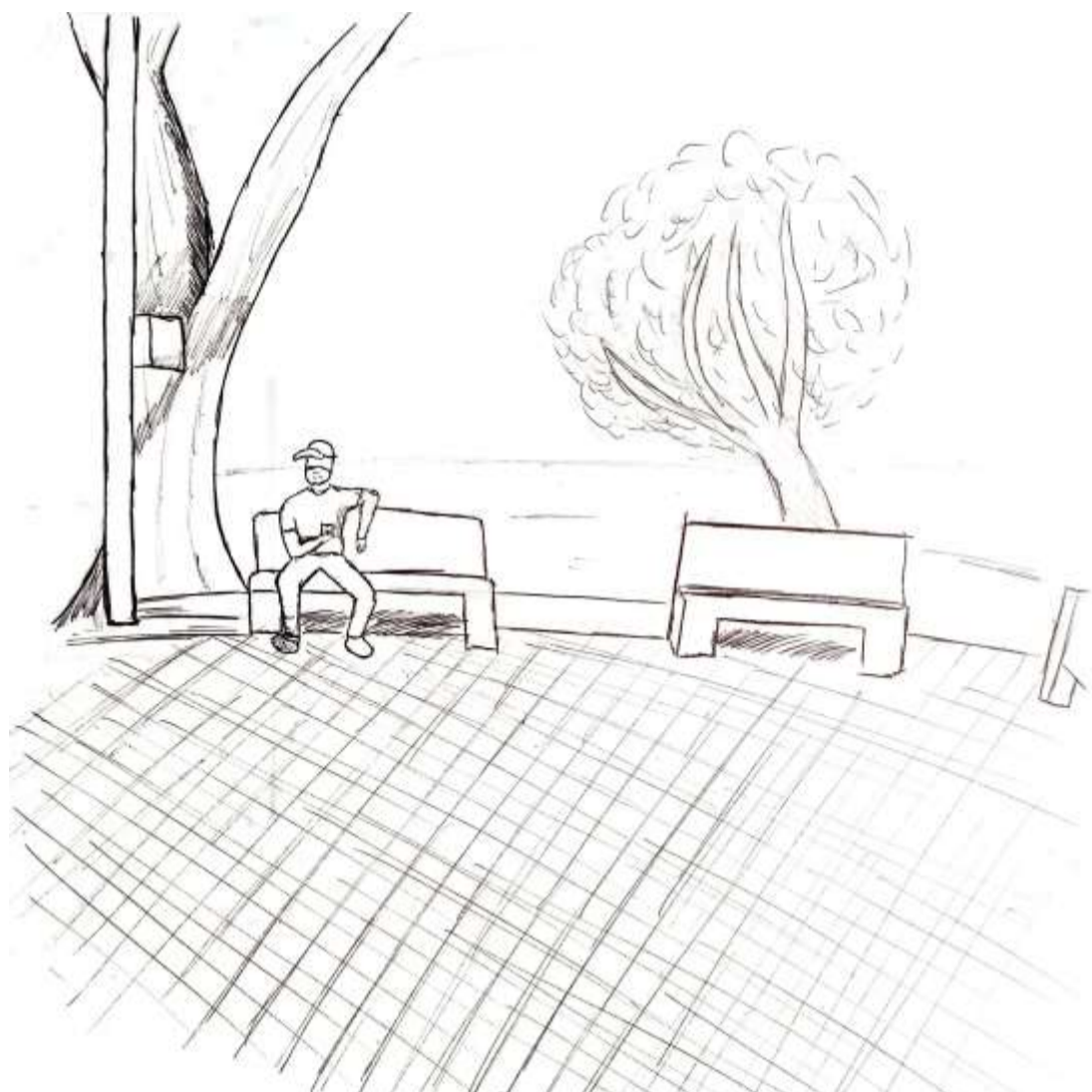
48- El centro de la plaza, un espacio libre y amplio, rodeado de manera circular de lonjas, genera una especie de escenario, haciendo que donde sea que te sientas, miras y tu atención esté en el mismo punto central, gracias a la dirección de las asientos.