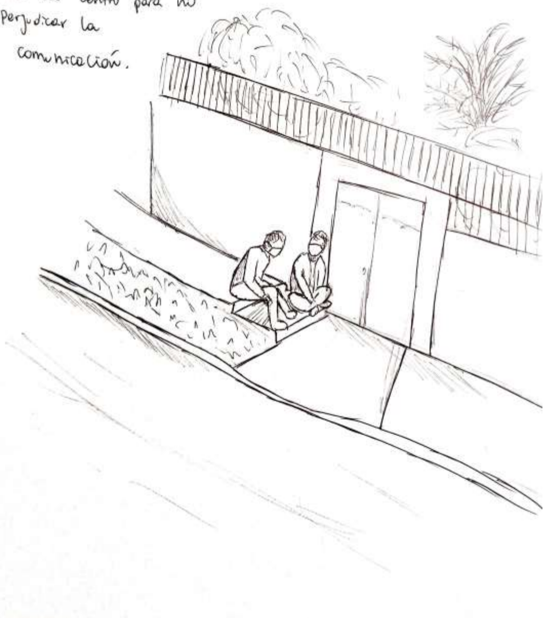
53- Una conversación casual dada en pleno verano, pero en un punto estratégico, donde sea cómoda la detención, alejados del ruido del centro para no perjudicar la comunicación.