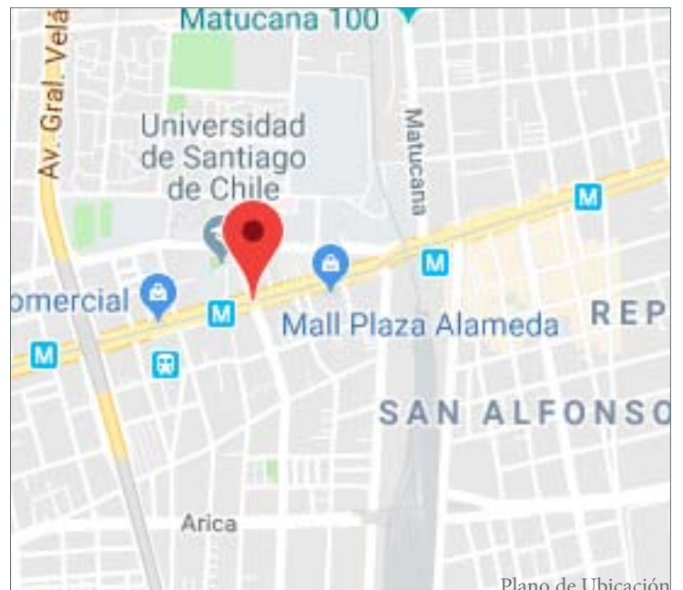
Plano de Ubicación

Superficie total: 44.000m 2 Superficies segregadas: Otros: