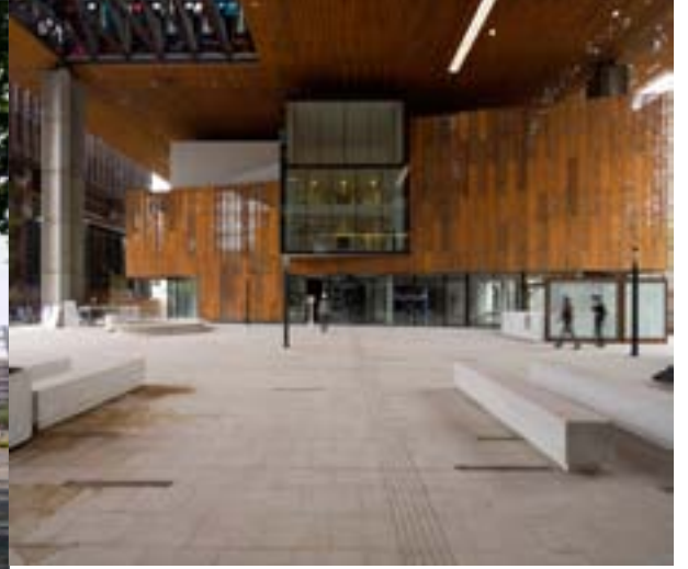
Fotografía de la primera entrada. un interior abierto