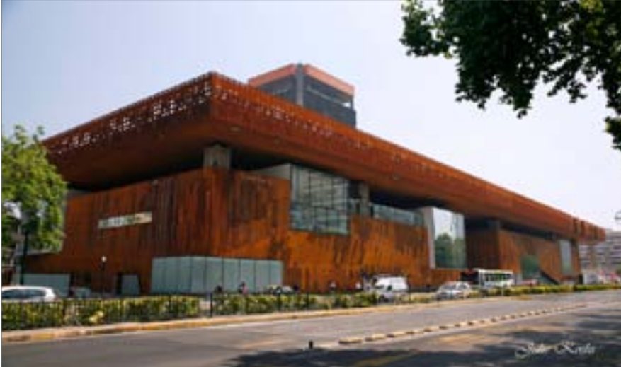
Fotografía desde el exterior