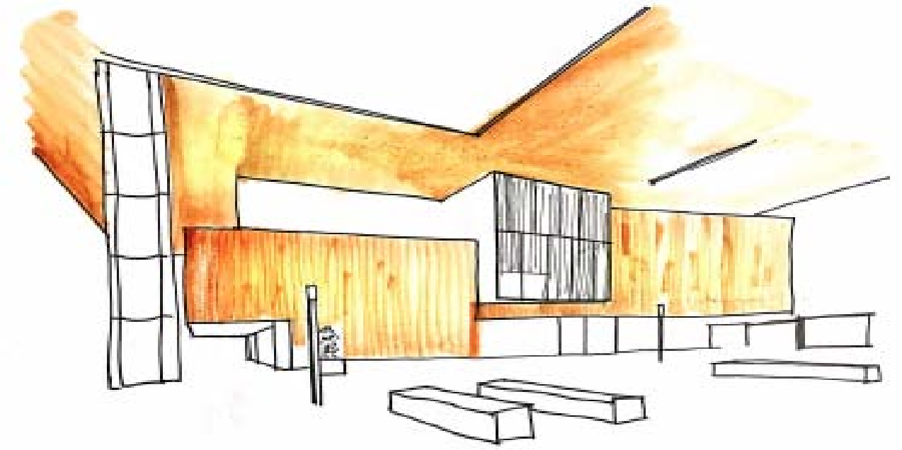
El patio interior aun abierto otorga un tiempo intermedio entre los edificios.