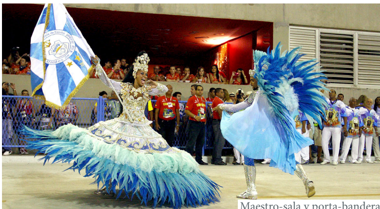
Maestro-sala y porta-bandera