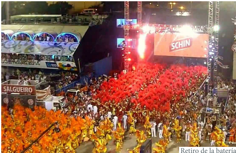
Retiro de la batería