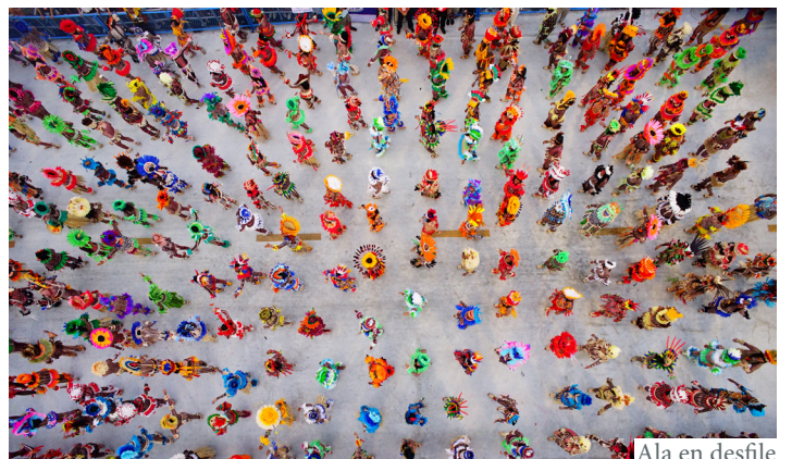
Ala en desfile