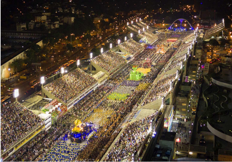
Vista aérea nocturna Sambódromo da Marquês de Sapucaí