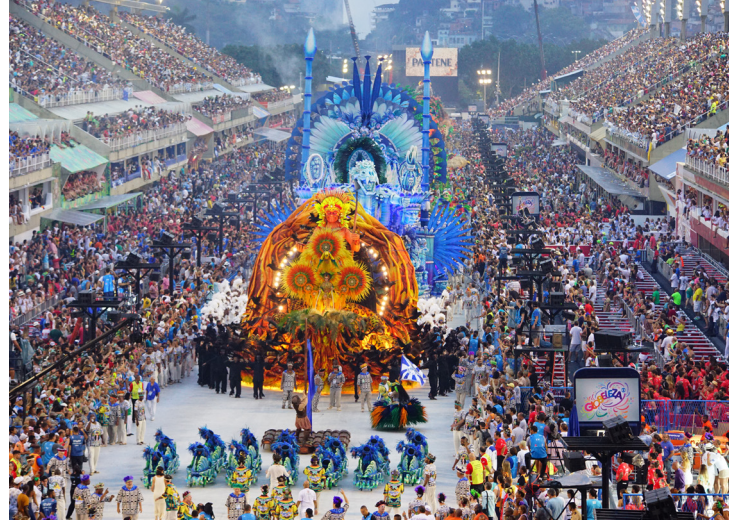
Vista aérea coche alegórico en desfile