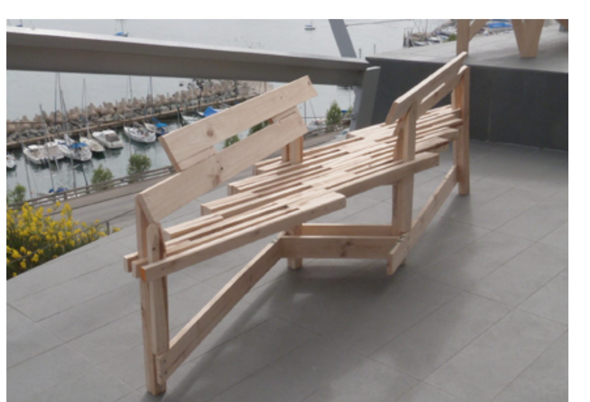
Vista Isometrica sitalia.