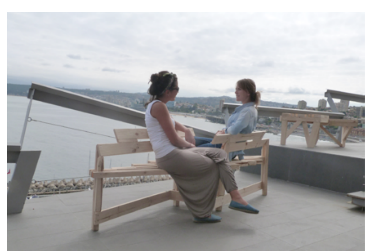
Sitalia en uso en el patio de la palmera

Se construye una pieza que le da la estabilidad a la dirección del sitio, esta estructura la tracción.