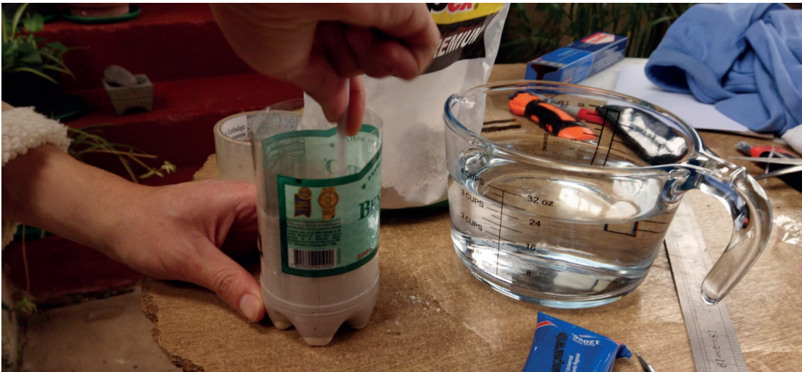
Fotos del proceso, respecto a como se desarrolla el tensado de la tela y las proporciones para la mezcla del yeso.