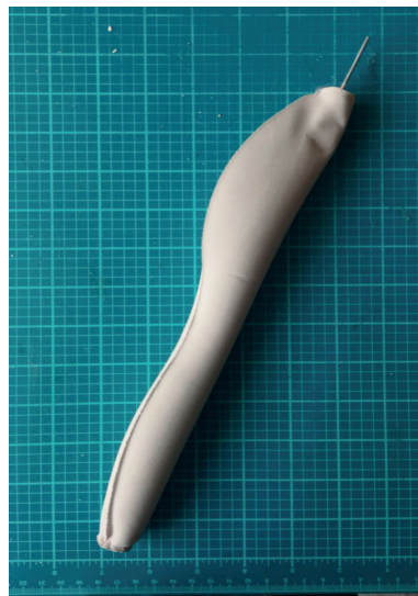
Finalizado del pilar respecto del alambre para permitir la capacidad de deformación y los detalles del género en la columna.