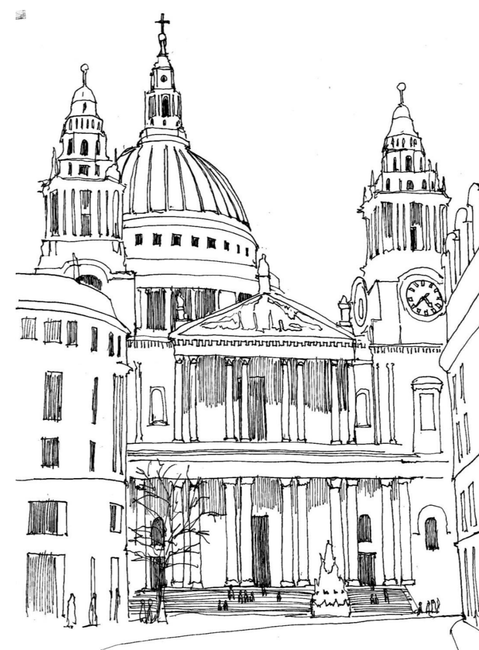
Vista de la fachada y acceso principal desde la avenida Ludgate Hill