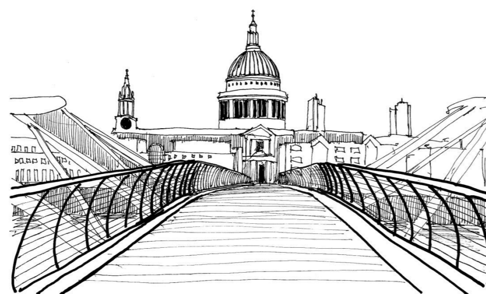
Vista de la fachada sur desde el Millennium Bridge.