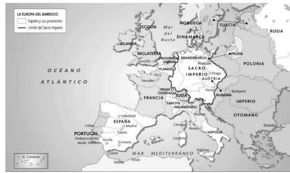
La situación política de Europa entre los siglos XVII y XVIII

El Barroco fue un periodo de la historia en la cultura occidental que produjo obras en el campo de la literatura, la escultura, la pintura, la arquitectura, la danza y la música, y que abarca desde el año 1600 hasta el año 1750 aproximadamente. Se suele situar entre el Renacimiento y el Neoclásico, en una época en la cual la Iglesia católica europea tuvo que reaccionar contra muchos movimientos revolucionarios culturales que produjeron una nueva ciencia y una religión disidente dentro del propio catolicismo dominante: la Reforma Protestante. Como estilo artístico el barroco surgió a principios del siglo XVII y de Italia se irradió hacia la mayor parte de Europa. Durante mucho tiempo (siglos XVIII y XIX) el término barroco tuvo un sentido peyorativo, con el significado de recargado, desmesurado e irracional, hasta que posteriormente fue revalorizado a fines de siglo XIX por Jacob Burckhardt y luego por Benedetto Croce y Eugenio.