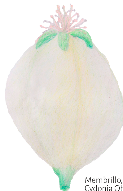
Membrillo, fruto de la Cydonia Oblonga