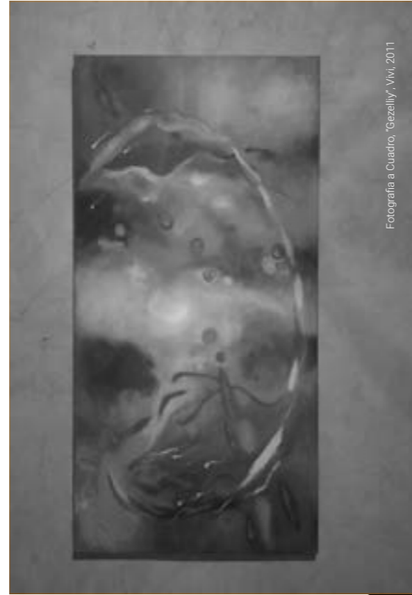
Fotografía a Cuadro, "Gezelly", Vm, 2011

Imágenes comprimidas con una expresión sublime dependiendo del observador, pero en sí, con un trasfondo seleccionado desde un comienzo para llamar la atención y persuadir, aun que de diferentes maneras, terminando en el entendimiento del mensaje inicial.