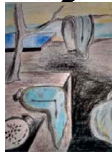
Reproducción de obra por Horacio Ritter Extracto: La persistencia de la memoria, Dalí, (1931)

Los artistas de AfriCOBRA no tenían motivos para apelar a los críticos que los omitían de la línea de tiempo del arte y los movimientos concurrentes. Las obras producidas por estos artistas estaban destinadas a empoderar a la comunidad negra. Se esforzaron por crear imágenes que expresaran la profundidad de la cultura negra y el panafricanismo, abrazando un árbol genealógico con ramas que se extendían más allá de Estados Unidos, llegando a los hogares ancestrales del Caribe y África.