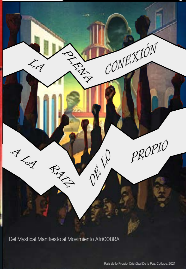
Del Mystical Manifiesto al Movimiento AfriCOBRA