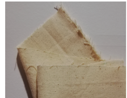
Tela de cañamo

La forma expuesta (FIGURA 1) es resultado de una exploración del imaginario y la traducción a una representación, la cual se refleja en la (FIGURA 2) que revela las dimensiones adquiridas y la manera "cálculo" de plasmarla en la tela.